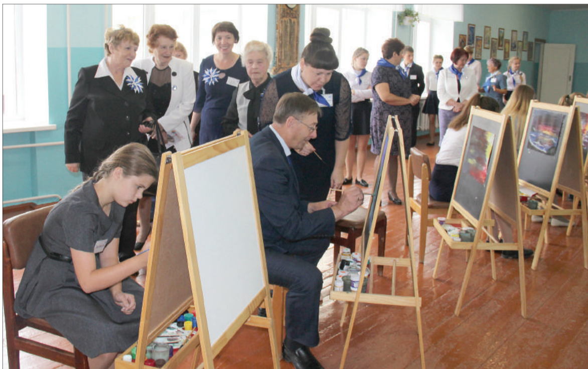
На мастер-классе глава района взял в руки кисть и краски.

Впечатлившись достижениями школы-юбилея, гости проследовали в актовзальный зал, где уже собрались родители учеников и, конечно, педагогический коллектив. Во время торжественной церемонии со сцены звучали теплые слова и поздравления, сказанные почетными гостями в адрес администрации школы, и конечно, педагогического коллектива. Именно труд рядового учителя дает возможность ученикам и школе в целом занимать призовые места и высокие позиции в рейтинге качества образования. Среди множества подарков был один необычный, подаренный председателем Октябрьского отделения ВДПО и куратором кадетских